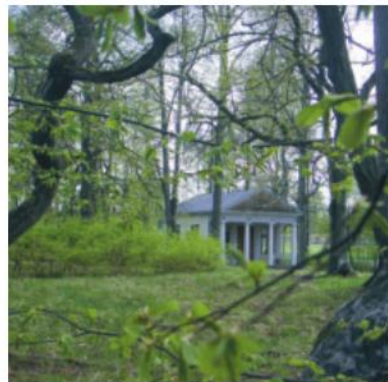
Engelska parken och lusthuset.

Bruksherrgården med källare, gästrumsflygel och bryggerhus är skyddade som byggnadsminnen. Detsamma gäller parken, kvarnen och kraftstationsbyggnaden samt parkens kastanjeallé och lusthuspaviljong.